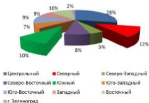
Численность рабочих (тыс. чел.)

3. К этой же таблице добавьте еще одну объемную круговую диаграмму с подписями данных